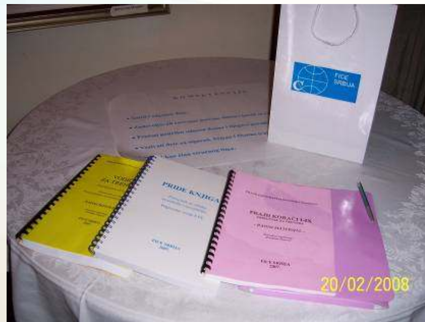
Materijali “PRIDE Pre-Service”